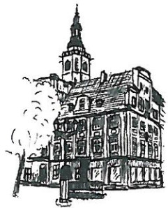
Rynek Wieża ratuszowa