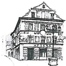
Kamienica „Pod Bykami”